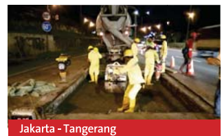
Jakarta - Tangerang