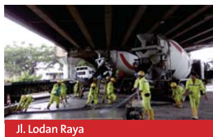
Jl. Lodan Raya