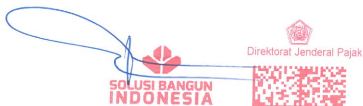
Agung Wiharto Direktur

METERAI TERAAN 18.02.2021 Rp 010000 348E 00013792 ID200897