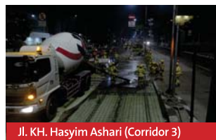
Jl. KH. Hasyim Ashari (Corridor 3)