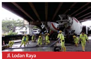
Jl. Lodan Raya