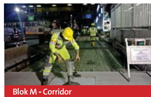
Blok M - Corridor