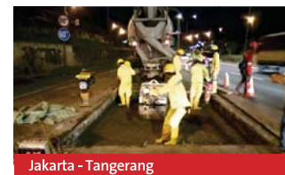
Jakarta - Tangerang