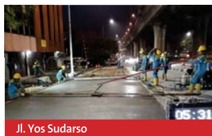
Jl. Yos Sudarso